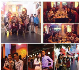
Thích: Bình luận · Chia sẻ