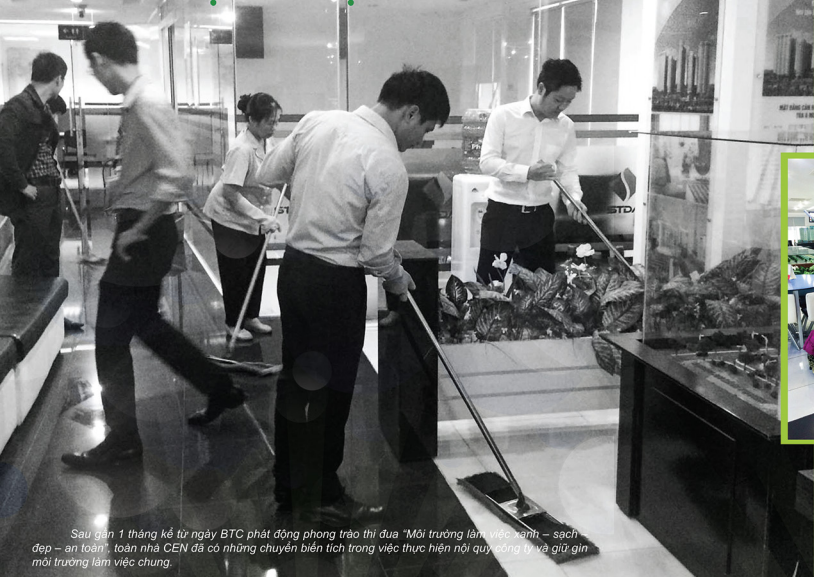
Sau gần 1 tháng kể từ ngày BTC phát động phong trào thi đua "Môi trường làm việc xanh – sạch – đẹp – an toàn", toàn nhà CEN đã có những chuyển biến tích cực trong việc thực hiện nội quy công ty và giữ gìn môi trường làm việc chung.

Theo BTC chương trình, phong trào thi đua "Môi trường làm việc xanh – sạch – đẹp – an toàn" được thực hiện nhằm phát triển hơn nữa Văn hóa nhà CEN, tạo môi trường làm việc trong lành, hấp dẫn, thúc đẩy động lực làm việc, tăng khả năng chủ động, sáng tạo cho toàn thể ACE.