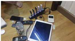
Thích: Bình luận · Chia sẻ

Em vào Veterans Tán Cảng ngày đón nắng Sg, tôi về sống chung với máy em này đây.