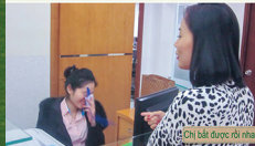
15 Chi bia được nhà CEN