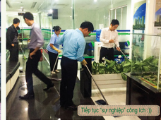
Tập tục "sử dụng" công cụ!!!