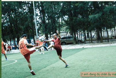
2 anh đang đo chân ấy mà

-Anh lính Công Điện- -team Công Điện nh-