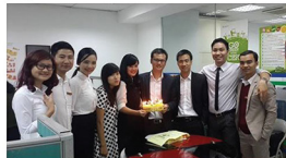
Thích: Bình luận · Chia sẻ