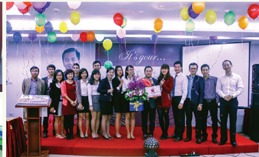
Nhà CEN đã cùng sắp chào đón một ngày sinh nhật thật đầm ấm