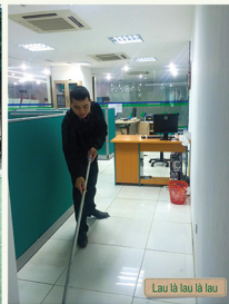
Lau là lau là lau